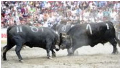
Combats de reines